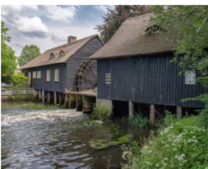
Nederwetten, Hooydonkse Watermolen