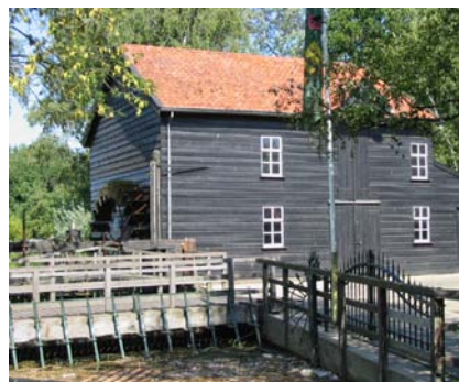
Valkenswaard, Venbergse Watermolen

Met een paspoort kan bijvoorbeeld mede worden aangetoond dat er in het landschap bij een bepaalde molen nieuwe beplanting dient te komen. Daarnaast is een zogenaamde quickscan uitgevoerd op 17 locaties van verdwenen molens. Dit onderzoek heeft, kort gezegd, als doel geschikte locaties te vinden die kansrijk zijn voor ruimtelijke ontwikkelingen rondom het waterbeheer, de bestrijding van verdroging en energieopwekking.