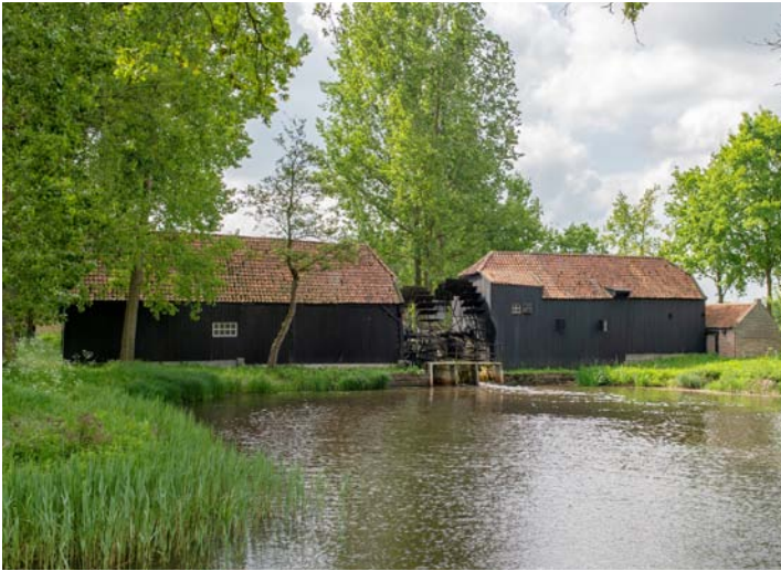
Eindhoven, Collse watermolen