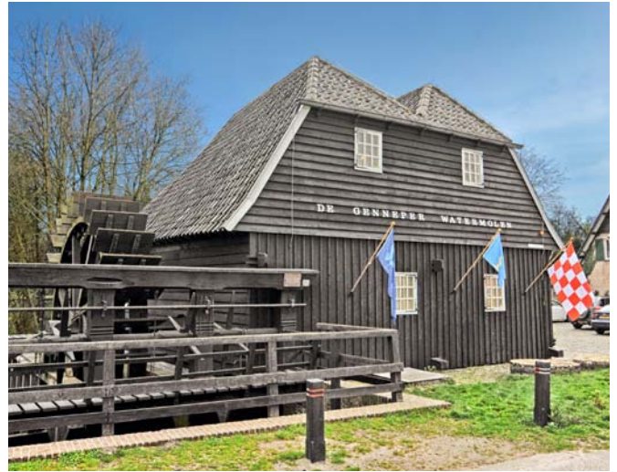
Eindhoven, Genneper Watermolen

Met een paspoort kan bijvoorbeeld mede worden aangetoond dat er in het landschap bij een bepaalde molen nieuwe beplanting dient te komen. Daarnaast is een zogenaamde quickscan uitgevoerd op 17 locaties van verdwenen molens. Dit onderzoek heeft, kort gezegd, als doel geschikte locaties te vinden die kansrijk zijn voor ruimtelijke ontwikkelingen rondom het waterbeheer, de bestrijding van verdroging en energieopwekking.