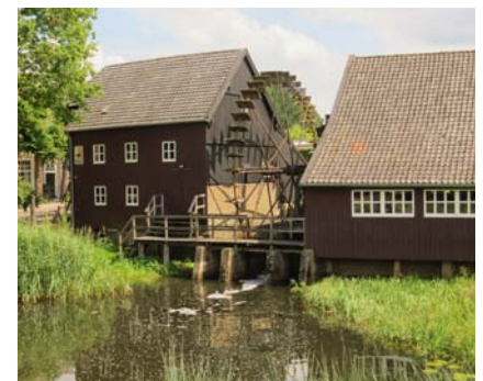
Nuenen, Opwettense Watermolen